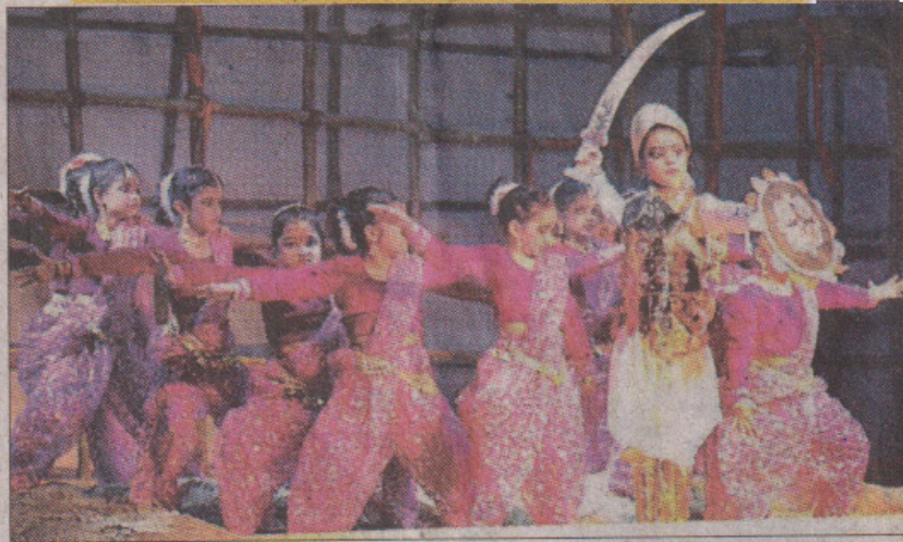
नोएडा के सेक्टर-30 स्थित डीपीएस में आयोजित कार्यक्रम में प्रस्तुति देती छात्राएं।