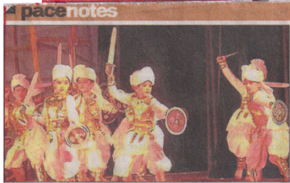
(Left) DPS, Noida organised its annual production, paying tribute to Rani Lakshmbai. (Right) Ryan International School, Ghaziabad was felicitated with the International School award by the British Council consecutively for the fourth time.