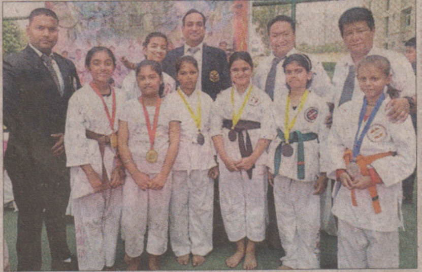
ग्रेटर नोएडा के केआर मंगलम वर्ल्ड स्कूल में कराटे चैंपियनशिप के विजेता खिलाड़ी।