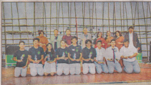
Delhi Public School, Noida