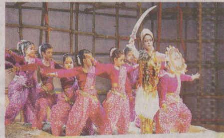
सेक्टर-30 स्थित दिल्ली पब्लिक स्कूल में नृत्य प्रस्तुत करती छात्राएं