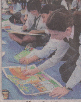
पेंटिंग करती छात्राएं।

दिल्ली पब्लिक स्कूल में आयोजित 'जेनिथ 2019' में छात्राओं ने दिखाई क्रिएटिविटी