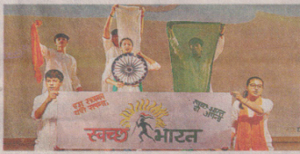
नाटक के जरिए स्वच्छता का संदेश देते विद्यार्थी • अतिथि