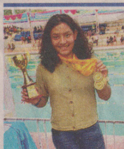
नव्या सिंघल • जागरण

यूपी स्टेट स्वीमिंग फेडरेशन ने प्रदान की सर्वश्रेष्ठ तैराक की ट्रॉफी, कई रिकॉर्ड को तोड़ हासिल किया मुकाम