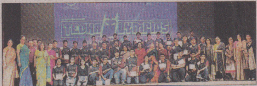
नोएडा के केंब्रिज स्कूल में हुई प्रतियोगिताओं में पुरस्कृत प्रतिभागी व शिक्षक।

इसमें वर्चुअल-वॉरिअर्स, टॉप कोडर्स, बैटल ऑफ बेन्स पिक्चर्स-क्यू गे