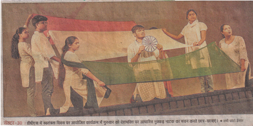
सेक्टर-30 : डीपीएस में स्वतंत्रता दिवस पर आयोजित कार्यक्रम में गुरुवार को देशभक्ति पर आधारित नुकड़ नाटक का मंचन करते छात्र-छात्राएं।

नवभारत टाइम्स, नोएडा, शुक्रवार, 16 अगस्त 2019