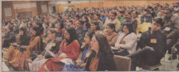
सेक्टर-30 स्थित डीपीएस में बैठक में हिस्सा लेते स्कूलों के प्रिंसिपल व शिक्षक।