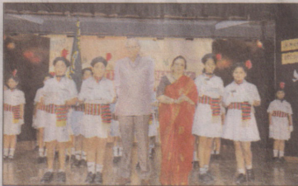
Delhi Public School, Noida

who congratulated all the new appointees. She stated that each dipsite strives to attain the impossible and