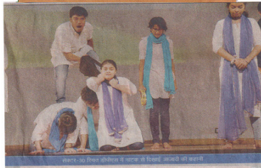
नई दिल्ली, 16 अगस्त 2019 दैनिक जागरण

नवभारत टाइम्स, नोएडा, शुक्रवार, 16 अगस्त 2019