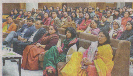
डीपीएस में आयोजित कार्यक्रम में मौजूद गणमान्य लोग