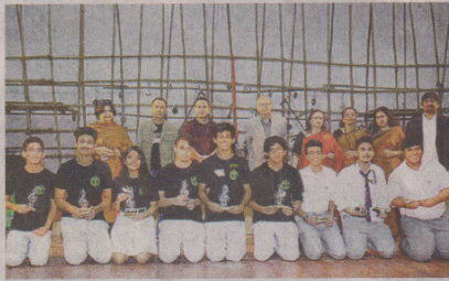
सेक्टर-30 स्थित दिल्ली पब्लिक स्कूल में आयोजित अंतर विद्यालय प्रतियोगिता में विजयी होने वाले प्रतिभागी विद्यार्थी •

क्लिकेथॉन फोटो प्रतियोगिता को पांच भागों में बांटा गया, जिसमें ऑन द स्पॉट फोटोग्राफी, ऑब्जेक्ट फोटोग्राफी, शॉर्ट फिल्म बनाना आदि शामिल थे। जिसमें छात्रों ने महात्मा गांधी के जीवन तथा उनके जीवन मूल्यों पर आधारित फिल्म बनाई। इसमें डीपीएस सोनीपत को ओवरऑल विजेता के रूप में पुरस्कृत किया गया। आर्ट क्लब के अंतर्गत फ्रेस्को फेस्ट पेंटिंग प्रतियोगिता में छात्रों ने महात्मा गांधी के जीवन से संबंधित विभिन्न घटनाओं को कैनवास पर उतारा। इसमें ग्रुप ए कैटेगरी में प्रथम