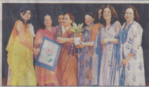
सेक्टर 30 स्थित दिल्ली पब्लिक स्कूल नोएडा में टीचर्स को किया गया सम्मानित

■ एनबीटी न्यूज, नोएडा : टीचर्स डे पर गुरुजनों के सम्मान में शहर में कई जगह कार्यक्रम हुए। खासतौर से स्कूलों में शिक्षक दिवस को लेकर धूम रही। अध्यापकों और छात्रों ने पूर्व राष्ट्रपति डॉ. सर्वपल्ली राधा कृष्णन की प्रतिमा पर पुष्प अर्पित कर उन्हें याद किया। छात्रों ने रंगारंग कार्यक्रमों की प्रस्तुति देकर सभी का दिल जीत लिया।