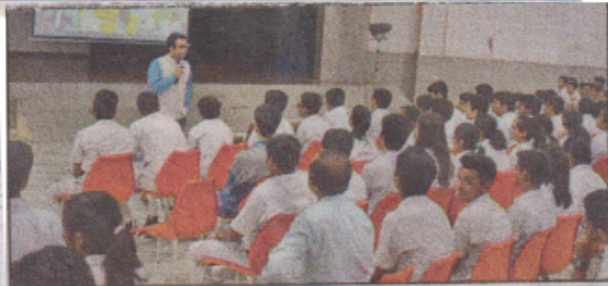
DPS, Sector 30, Noida