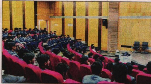
सेक्टर 91 स्थित पंचशील बालक इंटर कॉलेज में प्रधानमंत्री के मन की बात कार्यक्रम देखते बच्चे