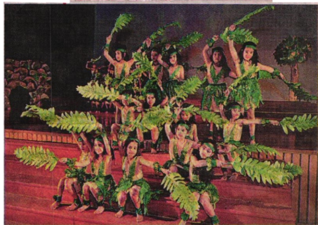
नोएडा सेक्टर-30 स्थित डीपीएस में कार्यक्रम के दौरान शानदार प्रस्तुति देते बच्चे।