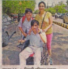
सक्षम 93%, दिल्ली पब्लिक स्कूल सेक्टर-30 दसवीं • जागरण

उन्होंने साबित किया है कि इच्छाशक्ति और मेहनत से विपरीत परिस्थितियों में भी सफलता हासिल की जा सकती है। उनके स्वजन उनकी सफलता पर बहुत खुश हैं। पूरे दिन उनके घर पर महुंकर उनकी ज़्यादा दे देना वालों का ताता लगा रहा।