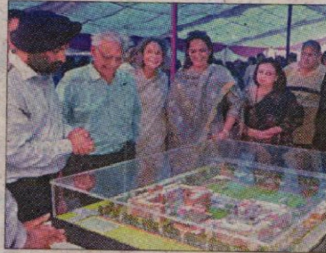
डीपीएस के कैंपस का प्रस्तावित मॉडल देखते अतिथिगण।