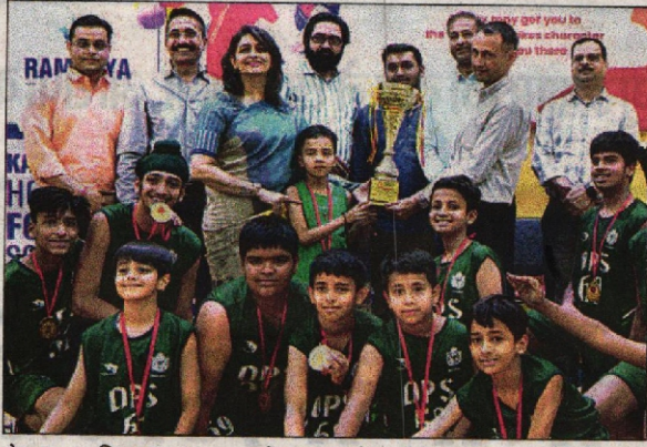
सेक्टर-50 स्थित रामाज्ञा स्कूल में बुधवार को आयोजित इंटर स्कूल बास्केटबॉल टूर्नामेंट की विजेता टीम के खिलाड़ियों को ट्रॉफी दी गई।