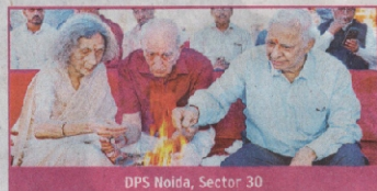
DPS Noida, Sector 30